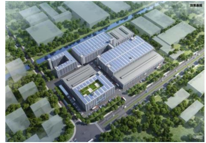
宁波慈东新工厂鸟瞰图